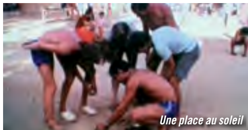
Une place au soleil

Fiction / France / 20' / 1970 / UPCB Fiction tragique sur les conditions de vie de trois cousins algériens à la recherche d'un travail en France. Logés dans un étroit réduit, le poêle à charbon provoque leur asphyxie. La face cachée de l'immigration.