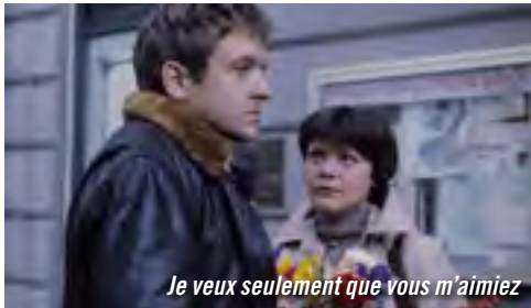
Je veux seulement que vous m'aimiez

TARIF 5 EUROS LA SÉANCE / BOURSE SPECTACLES 3 EUROS