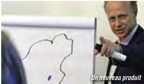
Un nouveau produit

De Harun Farocki Documentaire / Allemagne / 58' / 1997 / Harun Farocki Filmproduktion « Durant l'été 1996, nous avons filmé des stages où l'on apprend à poser sa candidature pour un emploi. [...] Universitaires, chômeurs de longue durée, managers, tous doivent apprendre à se vendre, au nom du self-management. » (H. F.)