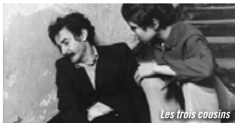
Les trois cousins

Fiction / France / 13' / 1970 / Unité production cinéma Bretagne (UPCB) Fable poétique et humoristique dans laquelle un immigré algérien traverse la Bretagne à la recherche d'un travail. Il trouve une carriole et se met à vendre des ajoncs dans un village. À la sortie de l'usine, les ouvrières en signe de solidarité ramassent les fleurs dispersées et les lui paient.