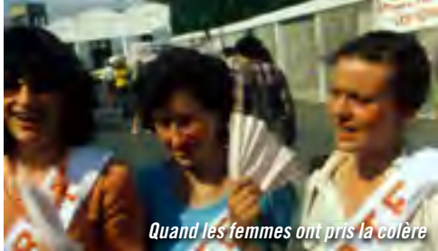
Quand les femmes ont pris la colère

TARIF 5 EUROS LA SÉANCE / BOURSE SPECTACLES 2,50 EUROS