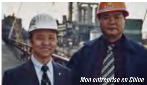
Mon entreprise en Chine