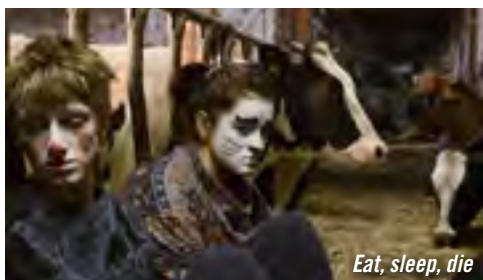
Eat, sleep, die

De Christian Johannes Koch Fiction / Allemagne / 21' / 2012 / Konrad Wolf (HFF) Prix de la création musicale du festival Premiers Plans d'Angers 2013 Une ferme isolée dans la campagne. Un homme se lève. En silence, il fait son travail.