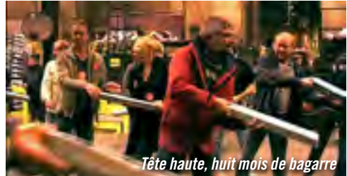
Tête haute, huit mois de bagarre

TAP CASTILLE AVANT-PREMIÈRE TARIF 5 EUROS LA SÉANCE / BOURSE SPECTACLES 3 EUROS